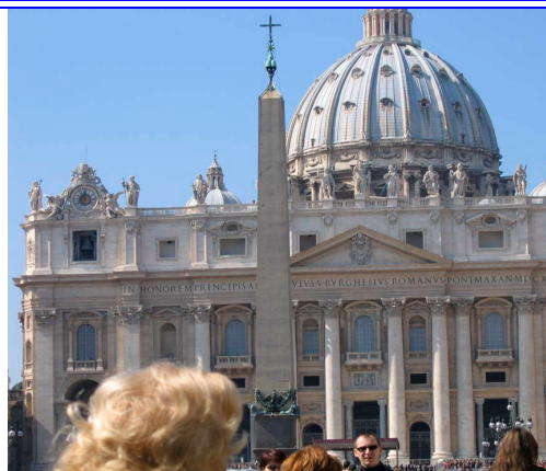
ROMA BASILICA di S. PIETRO Vedi video Clip ROMA VCRO1