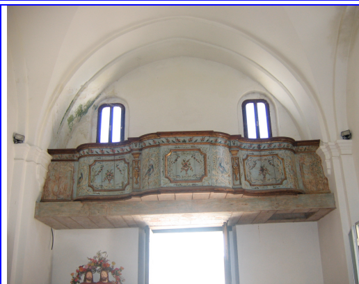
Miglionico Chiesa Madonna delle Grazie Cantoria Veneta 1600 http://www.comune.miglionico.mt.it

Scarica i files Gratuiti per l'ASCOLTO della LETTURA dei QUATTRO VANGELI, ATTI e LETTERE degli APOSTOLI, Brani della BIBBIA Dai siti internet - http://vangeli.net http://cristo-re.it http://maria-tv.it http://cristo-re.eu http://maria-tv.eu